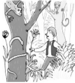
La isla del tesoro. ROBERT LOUIS STEVENSON

Por primera vez sentí la emoción del explorador. La isla estaba desierta; había dejado atrás a mis compañeros de barco y frente a mí no tenía más que fieras y aves. Anduve de un lado para otro por entre los árboles; de trecho en trecho florecían plantas que me eran desconocidas; vi algunas serpientes; una de ellas asomó la cabeza por detrás de una roca y siseó, emitiendo un sonido que se parecía al de una peonza al girar. Estaba lejos de suponer que se trataba de un enemigo mortal, y aquel sonido, el del famoso cascabel.